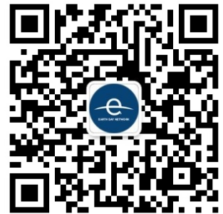
关注我们的微信公众号 获取更多关于亿绿行动及地球日信息