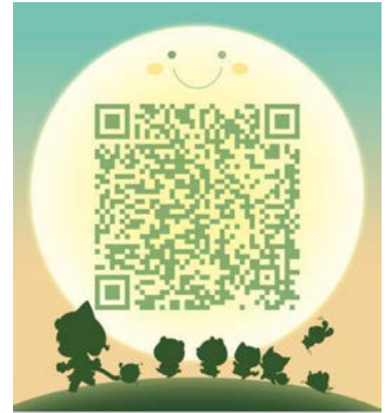
2017地球日亿绿行动 扫一扫二维码，加入该群。